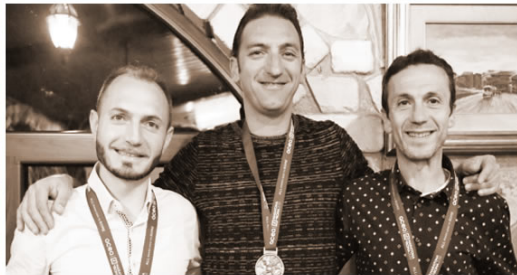
RICORRENZA DELLA MADONNA INCORONATA A TROIA