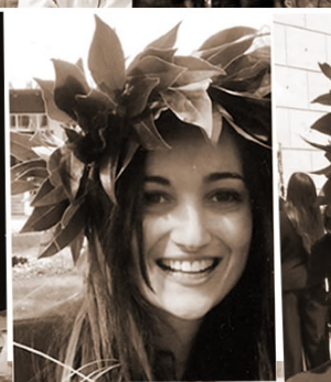
FIERA DEL LIBRO - 21 APRILE ASILO SAN BENEDETTO