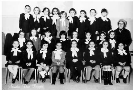
Giorno 27 agosto. In contrada