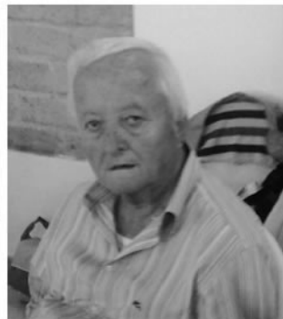
parenti tutti e gli amici ne ricordano la figura di padre esemplare.