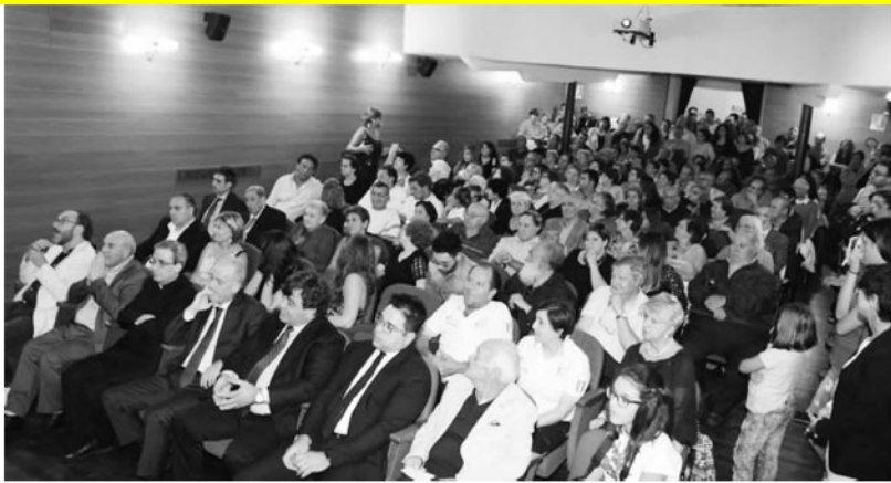
di Melfi che è stato premiato Se molta attesa c'è stata della sorte, anche sul palco del